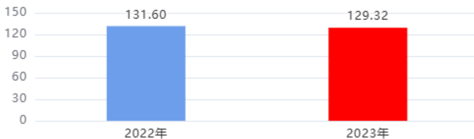
财政拨款收入、支出总计对比图 (单位: 万元)