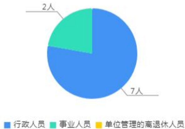
人员情况构成饼图