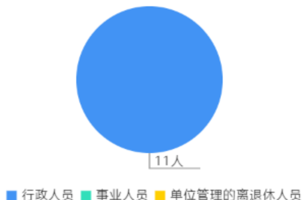
人员情况构成饼图

截止上年底，本单位人员编制11人，其中行政编制11人，事业编制0人；实有人员0人，其中行政11人，事业0人。单位管理的离退休人员0人。